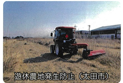
遊休農地発生防止 (太田市)