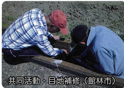
共同活動・目地補修 (館林市)