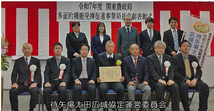
待矢場太田広域協定運営委員会