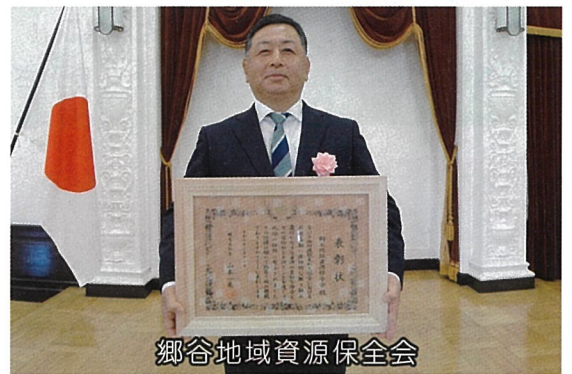
郷谷地域資源保全会