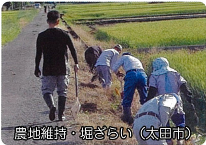
農地維持・堀ざらい (太田市)

当土地改良区では、広域組織をはじめ各活動組織の事務支援を行っています。これら事務支援や新たに取り組みを検討してみませんか・・・持続的な活動で、自分たちの手で、地域農業を守りましょう！