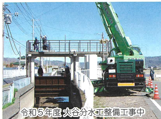
令和5年度大谷分水工整備工事中