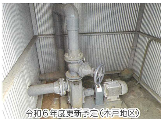
令和6年度更新予定(木戸地区)