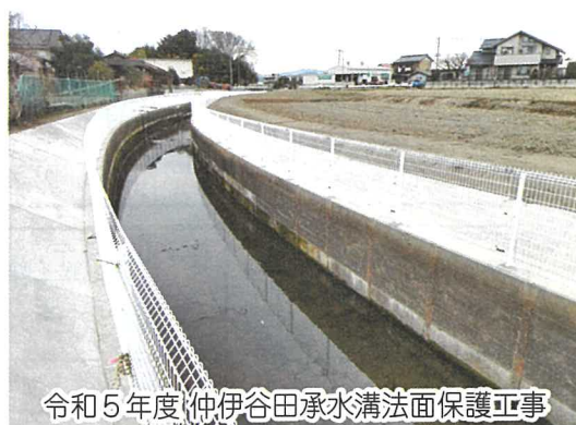
令和5年度仲伊谷田承水溝法面保護工事