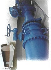
待矢場三栗谷発電所