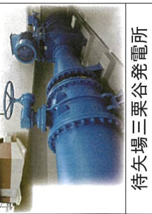
待矢場三栗谷発電所