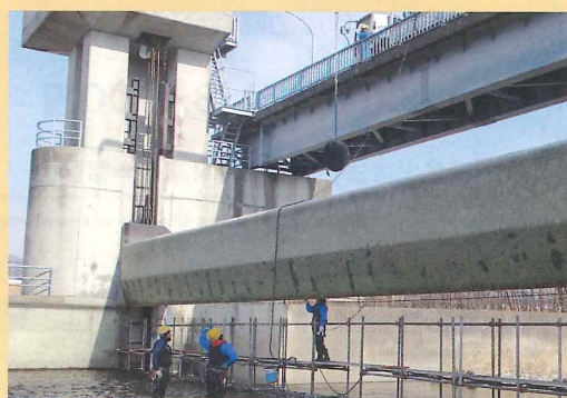
太田頭首工水密ゴム交換工事状況