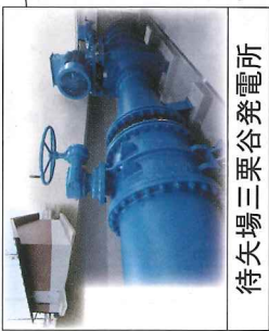
待矢場三栗谷発電所