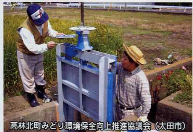
高林北町みどり環境保全向上推進協議会（太田市）