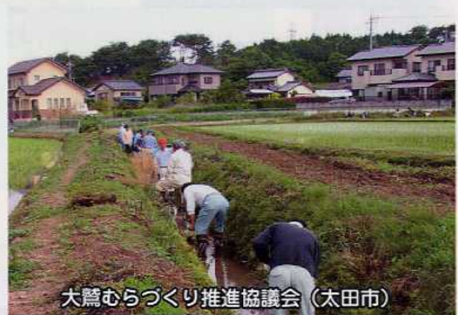
大鷲むらづくり推進協議会（太田市）